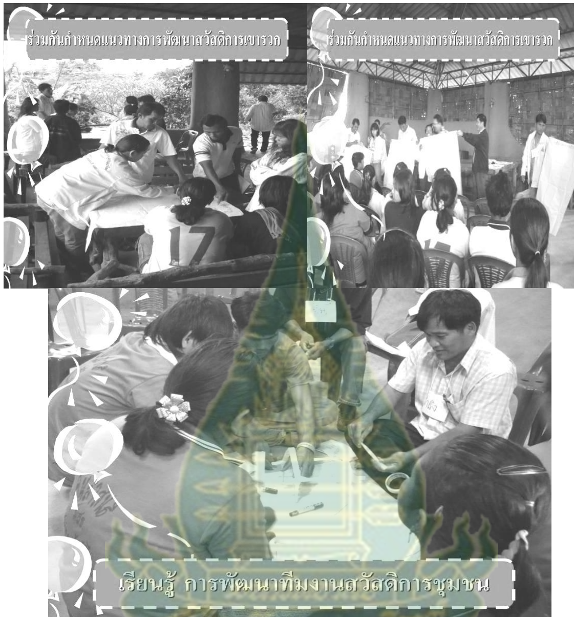
ภาพผนวกที่ 14 การสัมมนาเชิงปฏิบัติการการเสริมสร้างศักยภาพและ การกำหนดแนวทางการพัฒนาสวัสดิการชุมชนตำบลเขารวก