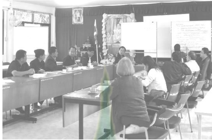
ภาพผนวกที่ 1 ชี้แจงโครงการวิจัยแก่เจ้าหน้าที่ สสว.8