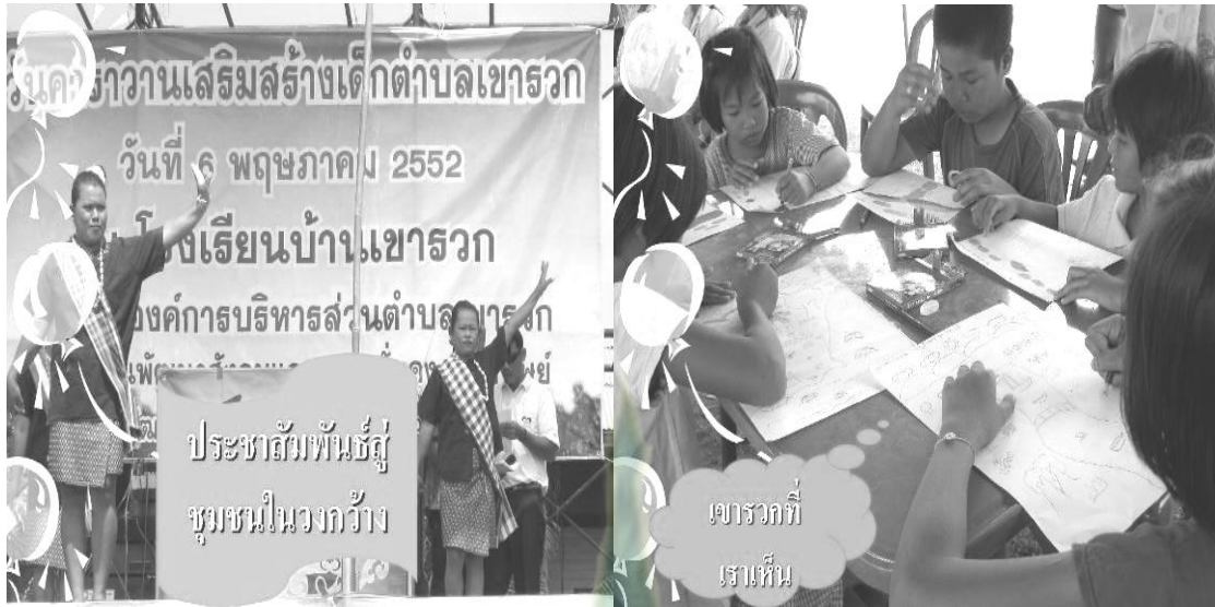
ภาพผนวกที่ 12 นักวิจัยชาวบ้านและกรรมการกองทุนฯ ร่วมงานวันคาราวานเสริมสร้างเด็ก ตำบลเขารวก