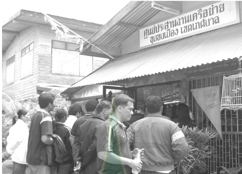
ภาพผนวกที่ 8 การศึกษาดูงานการจัดการเครือข่ายสวัสดิการชุมชนคนพิจิตร ณ จังหวัดพิจิตร