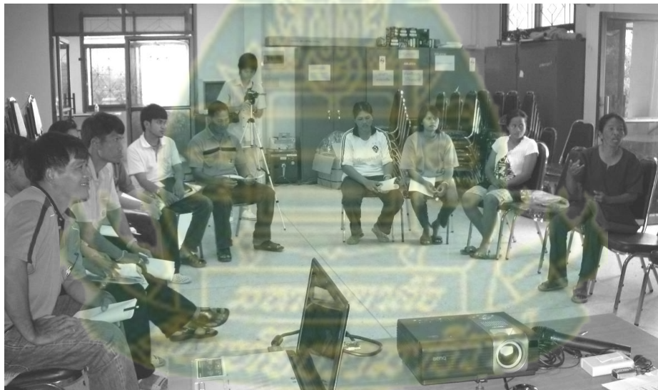
ภาพผนวกที่ 11 คณะผู้วิจัย มสธ. และกรรมการกลุ่มกองทุนสวัสดิการสรุปบทเรียน การทำงานที่ผ่านมาร่วมกัน