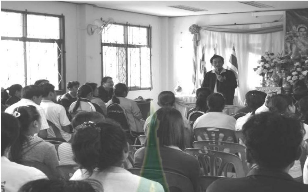
ภาพผนวกที่ 4 เวทีชุมชนวันที่ 15 ธ.ค.51 โดย ผอ.สสว.8 และคณะผู้วิจัย มสธ.

จัดเวทีชาวบ้านการบูรณาการกองทุนสวัสดิการชุมชน