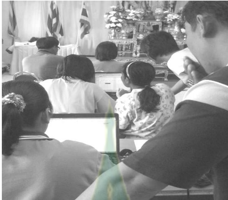
ภาพผนวกที่ 10 การบันทึกข้อมูลด้วยโปรแกรม excel โดยนักวิจัยชาวบ้าน