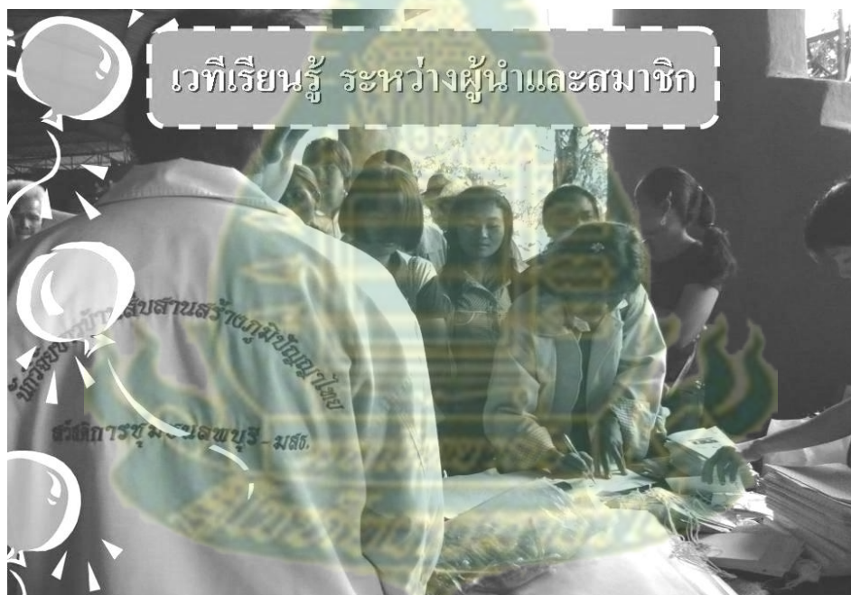
ภาพผนวกที่ 13 วันแรกของการสัมมนาเชิงปฏิบัติการการเสริมสร้างศักยภาพและการกำหนดแนวทางการพัฒนาสวัสดิการชุมชนตำบลเขารวก