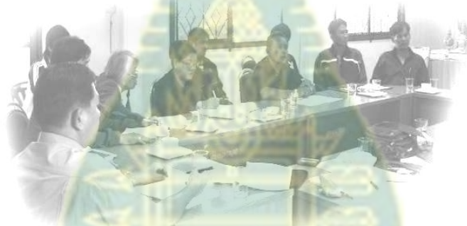
ภาพผนวกที่ 2 ชี้แจงโครงการวิจัยแก่ผู้นำชุมชนและกรรมการกลุ่มสวัสดิการชุมชน