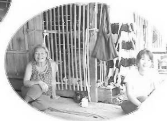
ภาพผนวกที่ 3 การเก็บข้อมูลชุมชนเบื้องต้นโดยคณะผู้วิจัย มสธ.