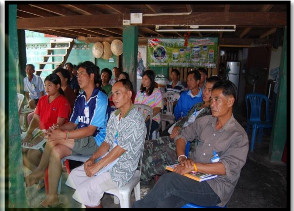
บ้านสันหนองเหนียว พะเยา