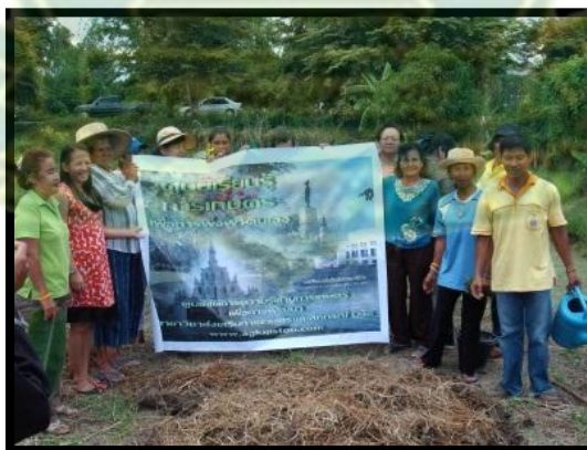
บางพลับ นนทบุรี