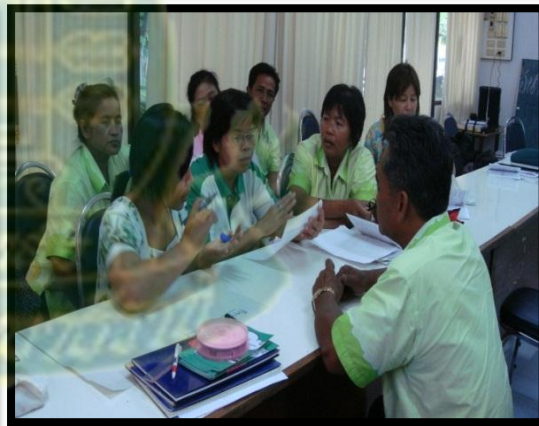
คลองอ้อม ประจวบคีรีขันธ์