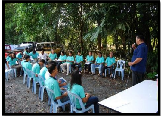
เขาสมิง ทรายาด