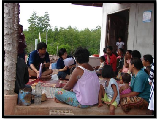
บ้านมุตู กระบี่