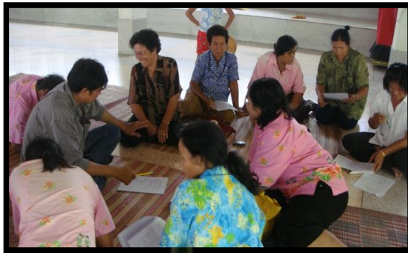
บ้านลาด ชัยภูมิ