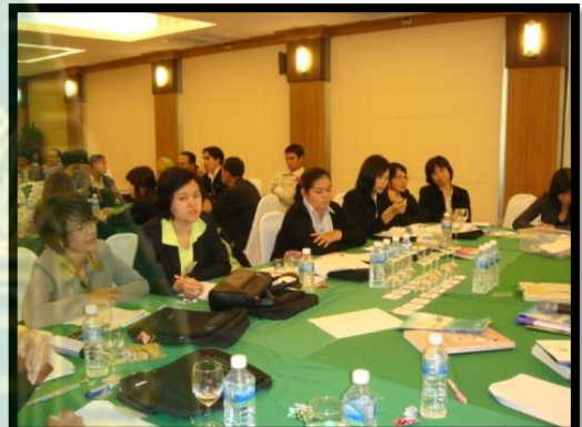
สัมมนา (ร่าง) รูปแบบ