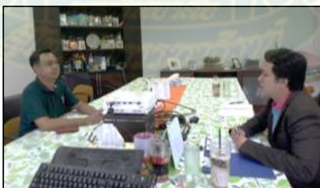
เข้าสัมภาษณ์ คุณกฤษดา ศึกษากิจ รองผู้จัดการโรงงาน บริษัท แอสปี้เซฟ (ประเทศไทย) จำกัด