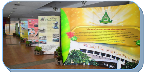
ภาพกิจกรรมจาก “งานประชาสัมพันธ์ มหาวิทยาลัยสุโขทัยธรรมมาธิราช “