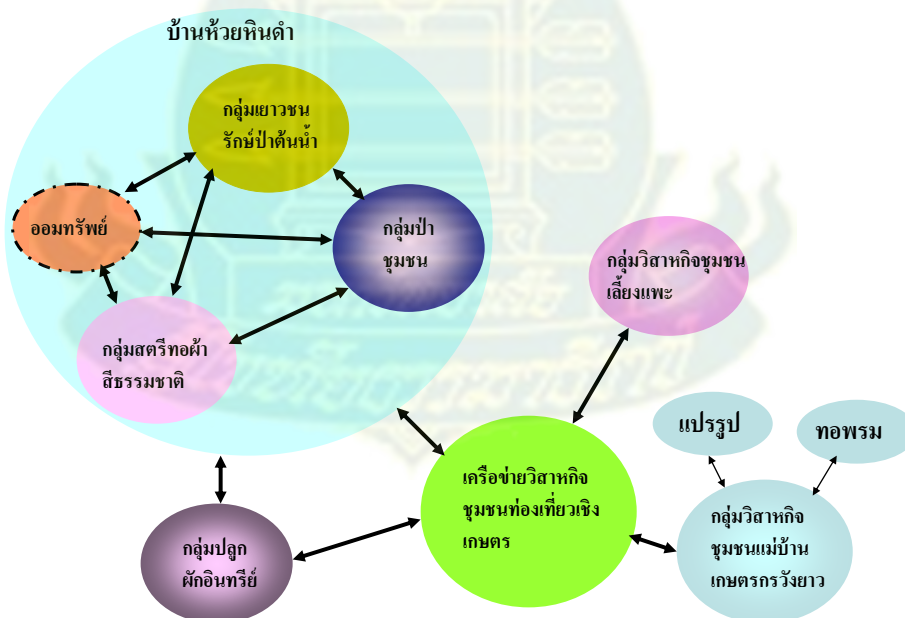
ผังแสดงกิจกรรมกลุ่มต่างๆใน ต.วังยาว อ.ด่านช้าง จ.สุพรรณบุรี

กิจกรรมด้านต่างๆ ที่กลุ่มในตำบลวังยาว อ.ด่านช้าง จ.สุพรรณบุรี มีการดำเนินการ ดังภาพ