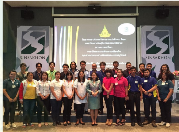
ถ่ายรูปร่วมกัน