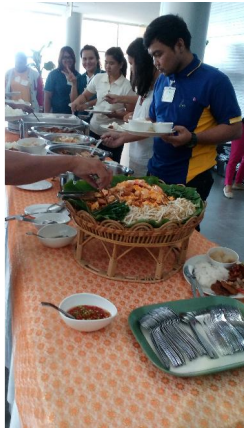
รับประทานอาหารกลางวัน