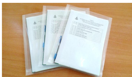
ภาพชุดฝึกอบรม