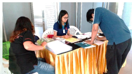
การลงทะเบียน