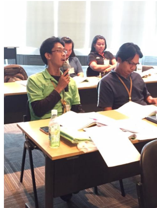
สอบถามข้อสงสัย