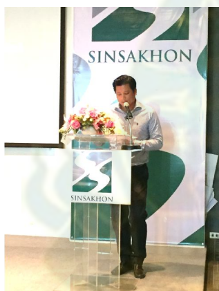
กล่าวเปิดงานโดยผู้อำนวยการนิคมสินสาคร