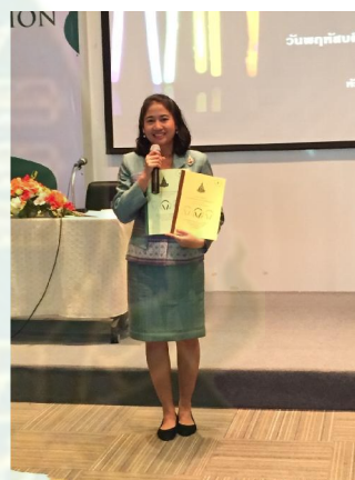
แนะนำชุดฝึกอบรม