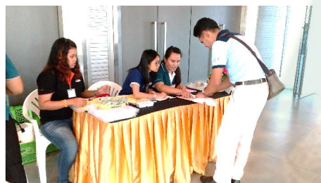
การลงทะเบียน