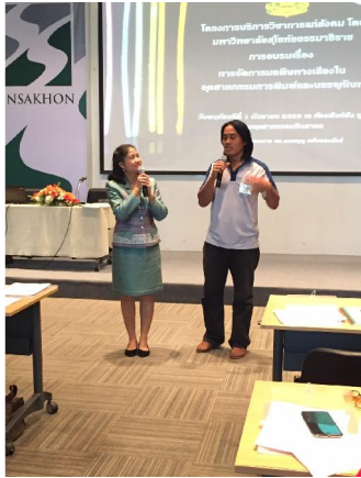
ดำเนินการอบรม